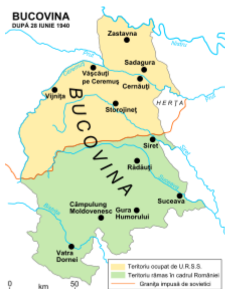
Bucovina divizată în iunie 1940